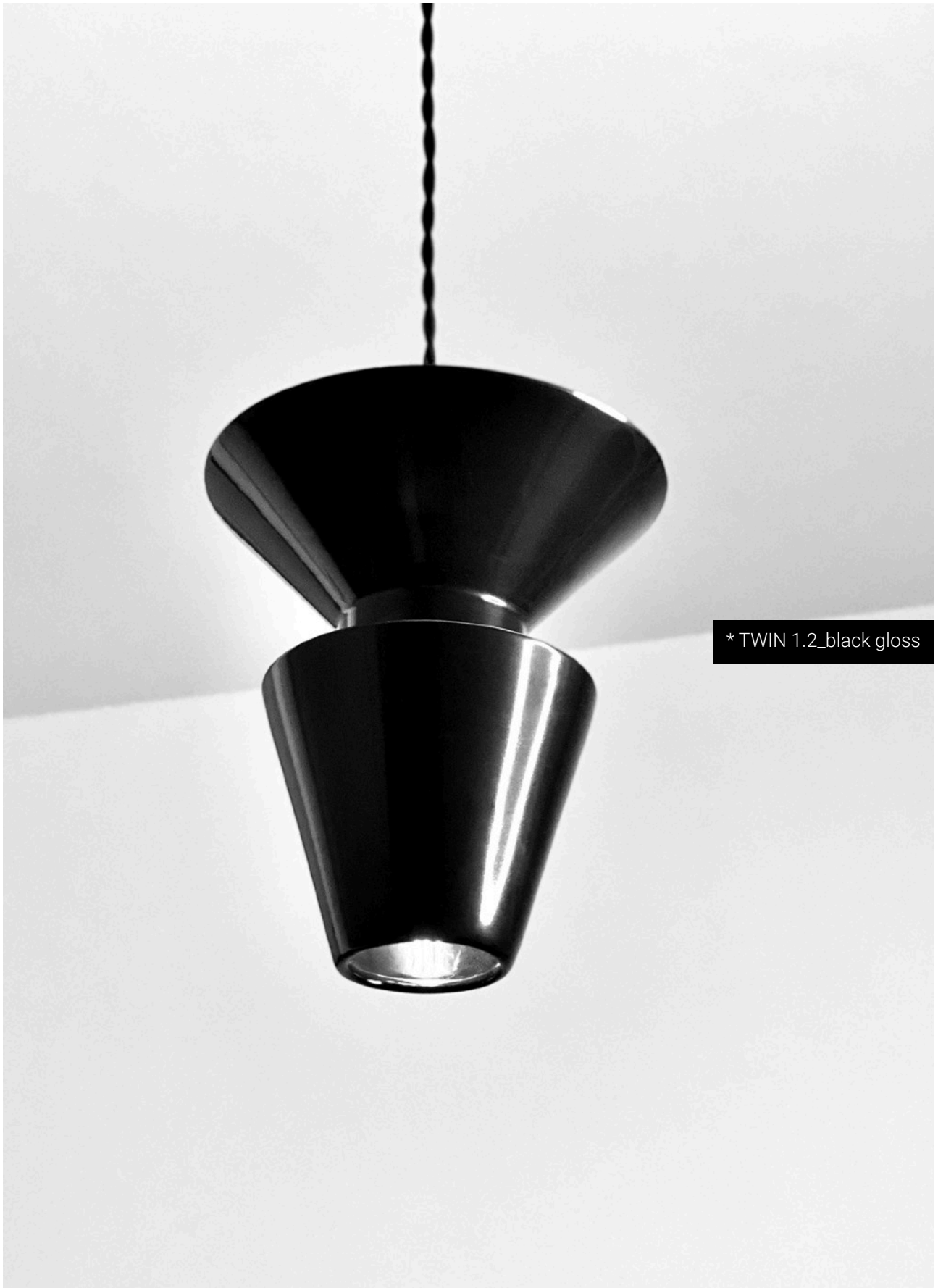
* TWIN 1.2_black gloss