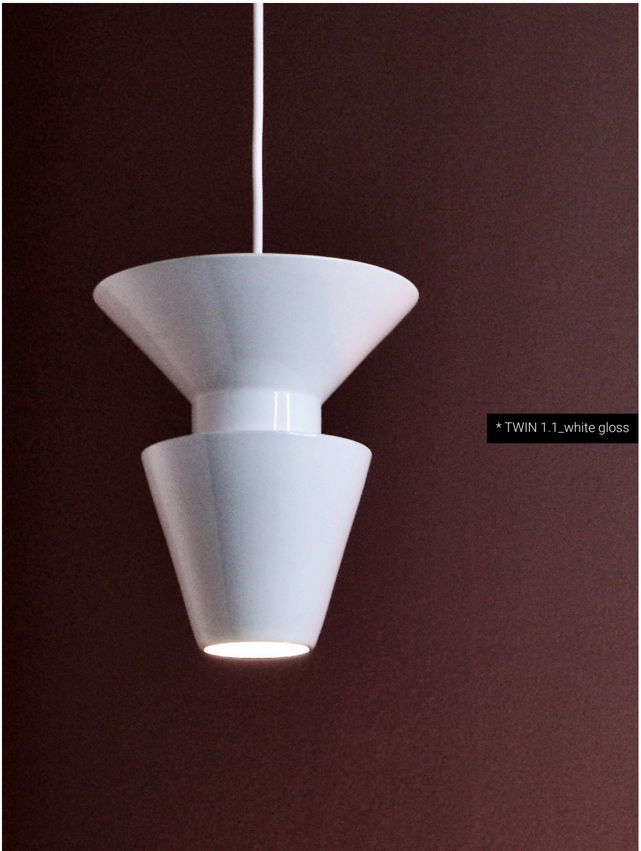
* TWIN 1.1_white gloss