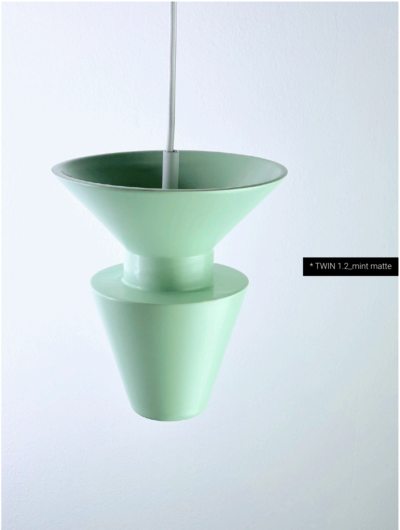
* TWIN 1.2_mint matte